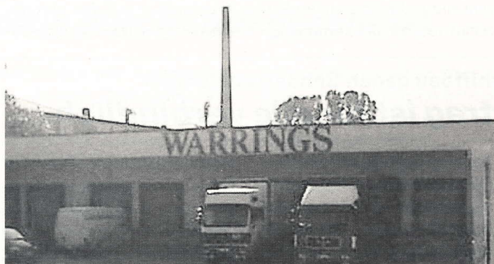
Druck brachte den Durchbruch: Im Ergebnis wurde der Flächentarifvertrag mit einer stufenweisen Anpassung bei den Sonderzahlungen anerkannt