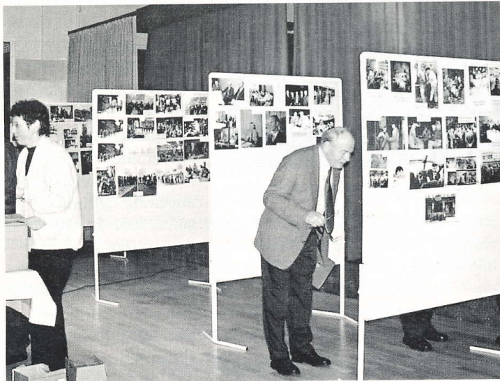
Fotoausstellung zur Jubilarehrung