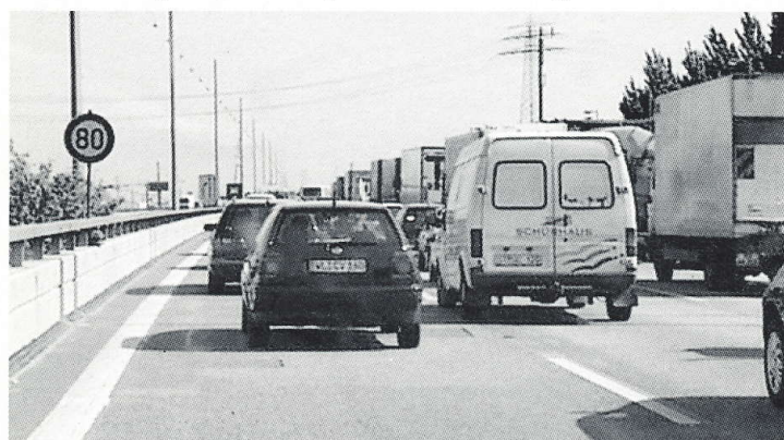
Einen schönen, erholsamen Urlaub ohne Stau, wünscht die Redaktion