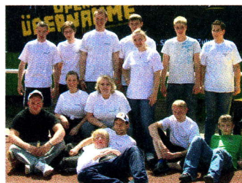
Mannschaft von Impress aus Cuxhaven