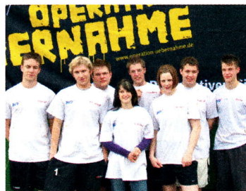
Mannschaft von BLG Autotec

Unsere Mannschaften aus Bremerhaven und Cuxhaven spielten im guten Mittelfeld mit.