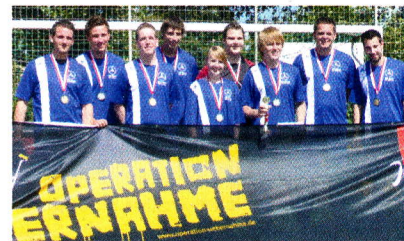
Erster Platz: Daimler-Niederlassung Bremen