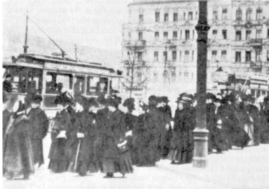
Demonstration zum Internationalen Frauentag in Berlin 1911

Aussage eines männlichen Delegierten der SPD auf dem Parteitag 1913: