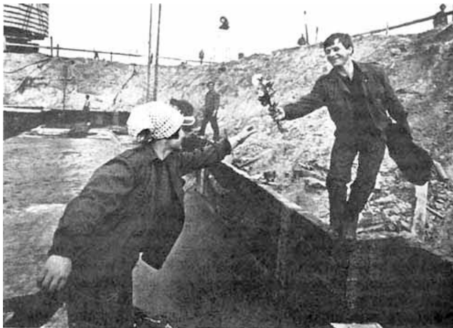
8. März auf einer Baustelle in der DDR

Nach dem 2. Weltkrieg fanden in der sowjetischen Besatzungszone bereits 1946 wieder Feiern zum Frauentag statt. In den sozialistischen Ländern, auch in der DDR, wurde die gesellschaftliche Befreiung der Frau gefeiert. Der Tag wurde mit offiziellen Feiern für die Frauen organisiert, um die sozialen Errungenschaften des Staates für die Frauen herauszustellen.