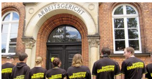
Solidaritätsaktion: Operation Übernahme

Schlappe beim Arbeitsgericht Bielefeld für Maschinenhersteller Fischer & Krecke