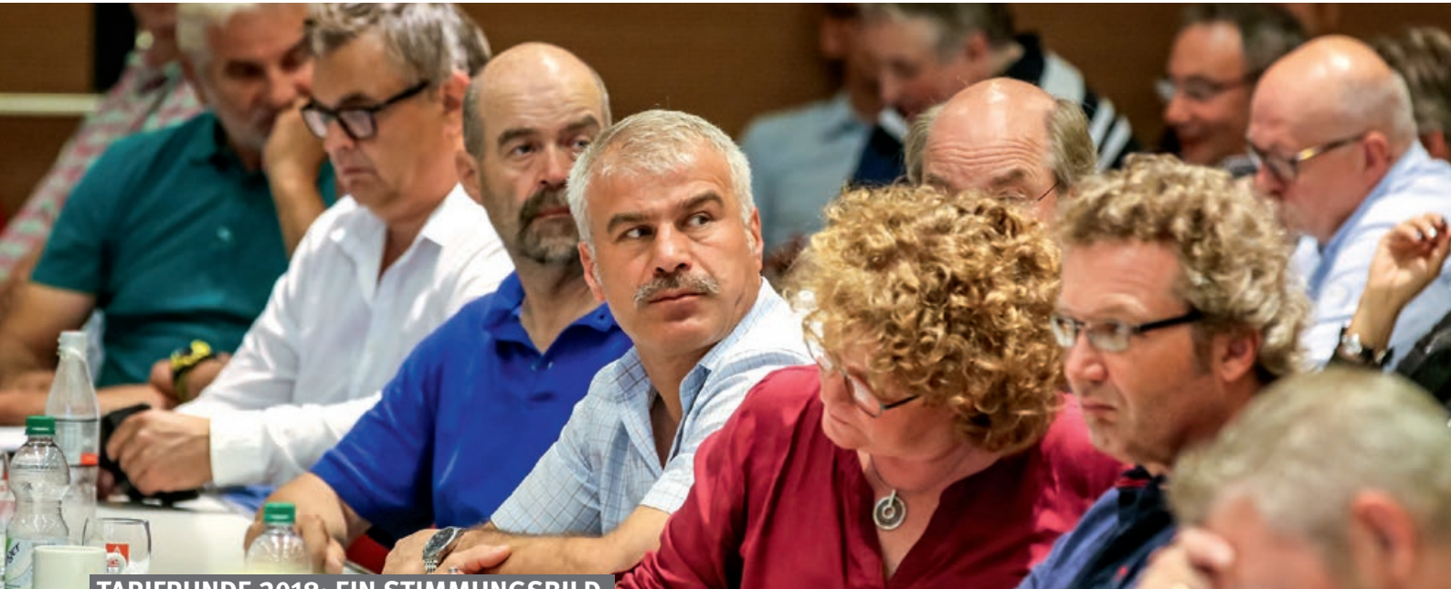
TARIFRUNDE 2018: EIN STIMMUNGSBILD